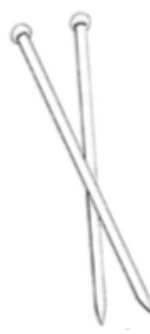
Agujas tejer nº 3