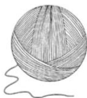
2 ovillos Katia Panamá